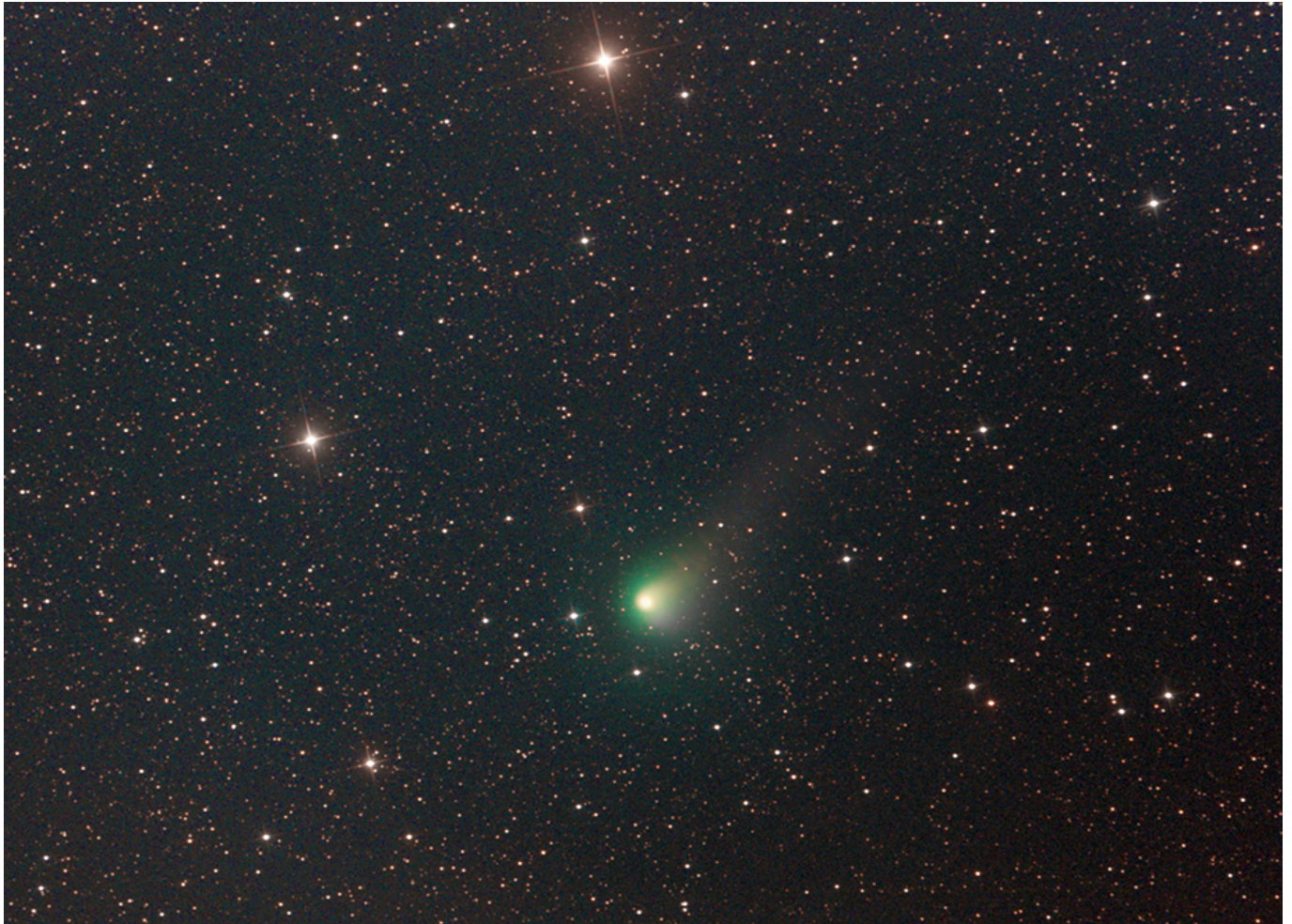
Komet C/2017 T2

Dieser bereits im Herbst 2017 entdeckte Komet passiert Anfang Mai 2020 sein Perihel und kann von Spezialisten in den nächsten Wochen sogar im Fernglas aufgefunden werden (Details finden sich in der Datei Info_AVKa_8.pdf).